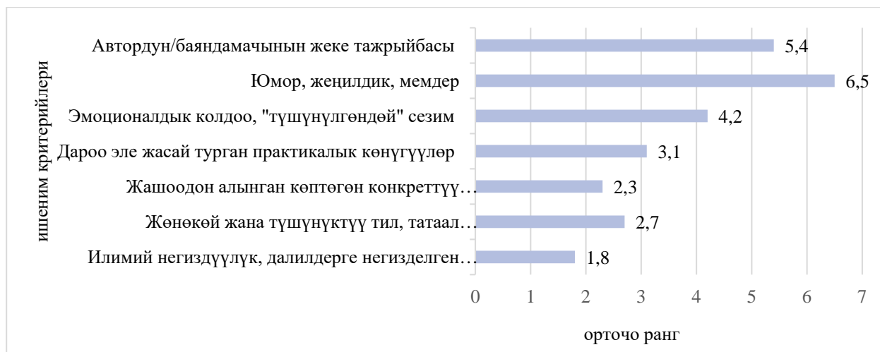
Сүрөт 3. Психологиялык мазмундун сапатынын критерийлери (орточо ранг)

Талдоо жана интерпретация. Илимий негиздүүлүккө болгон жогорку сурам (1-ранг) – өтө маанилүү жыйынтык. Маалыматтык ызы-чуу шартында калк ишенимдүү билимди айырмалоо жөндөмдүүлүгүн жана ага таянуу каалоосун көрсөтөт. Бул заманбап психологиядагы «маалыматтуу керектөөчү» концепциясына ылайык келет (Charles et al., 1999). Респонденттер белгилешет: « Кеңештер жөн эле блоггердин пикири эмес, илимий жактан тастыкталганы маанилүү » (аял, 29 жаш, Ош ш.).