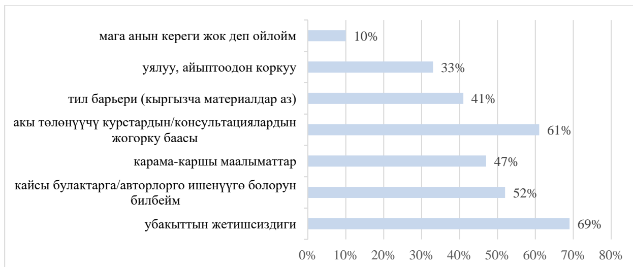
Сүрөт 4. Психологиялык билим алуудагы тоскоолдуктар

Талдоо жана интерпретация. Психологиялык билимге кайрылууга тоскоол болгон тоскоолдуктарды талдоо көйгөйлөрдүн бир нече деңгээлин бөлүп көрсөтүүгө мүмкүндүк берет. Убакыттын жетишсиздигинин үстөмдүгү (69 %) мурда аныкталган кыска форматтарга болгон сурам менен түздөн-түз корреляцияланып, агартуучулук контентти маалыматтык коомдун реалдуулуктарына ылайыкташтыруу зарылдыгын көрсөтөт. Жеткиликтүүлүктүн жогорку баасы (61 %) өз кезегинде акысыз жана жеткиликтүү агартуучулук демилгелерди, өзгөчө мамлекеттик сектордо, өнүктүрүү маселесин актуалдаштырат.