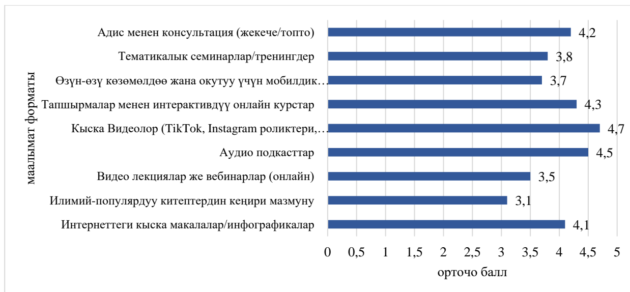
Сүрөт 2. Психологиялык маалыматты алуунун артыкчылыктуу форматтары

Талдоо жана интерпретация. Кыска видеолордун лидерлиги (4,7) клипстик ой жүгүртүүгө жана убакыттын жетишсиздигине болгон дүйнөлүк треннди чагылдырат. Н. Каррдын (2010) изилдөөсү кыска маалыматтык блоктордун ортосунда дайыма которулуп туруу адаттыгынын физиологиялык жактан мээнин түзүлүшүн өзгөртүп, нейрондук тармактарды кайра кураарын көрсөтөт. Бул когнитивдик адаттардын трансформациясы психологиялык агартуу үчүн кош эффект жаратат. Бир жагынан, татаал концепцияларды кабыл алууда жөнөкөйлөтүү жана тереңдикти жоготуу коркунучу келип чыгат. Экинчи жагынан, маалыматтык адаттарына байланыштуу эч качан китеп колуна албагандарды психология жөнүндөгү диалогго тартуунун уникалдуу мүмкүнчүлүгү пайда болот.