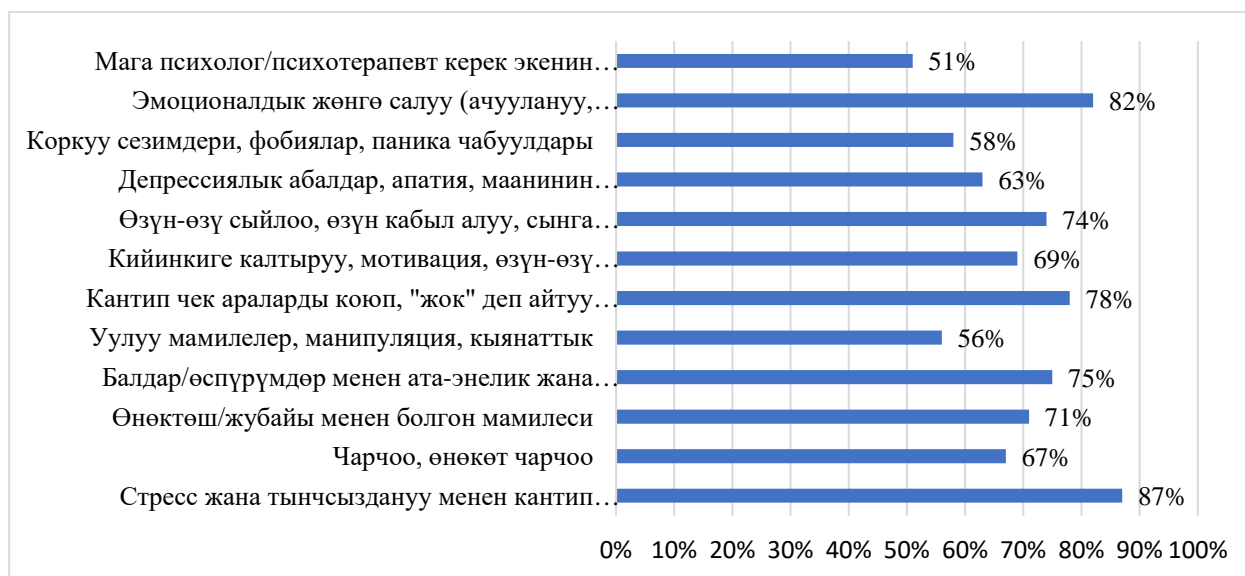
Сүрөт 1. Фергана өрөөнүнүн чек арага жакын аймактарынын калкы үчүн психологиялык темалардын актуалдуулугу

Сунушталган 12 тема боюнча жоопторду талдоо маалыматтык муктаждыктардын так иерархиясын аныктоого мүмкүндүк берди. Негизги көрсөткүч катары теманы 5 баллдык шкала боюнча 4 же 5 баллга баалаган респонденттердин пайызы алынган.