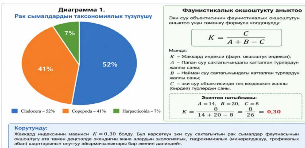
Сүрөт 1. Рак сымалдардын таксономиялык түзүлүшү