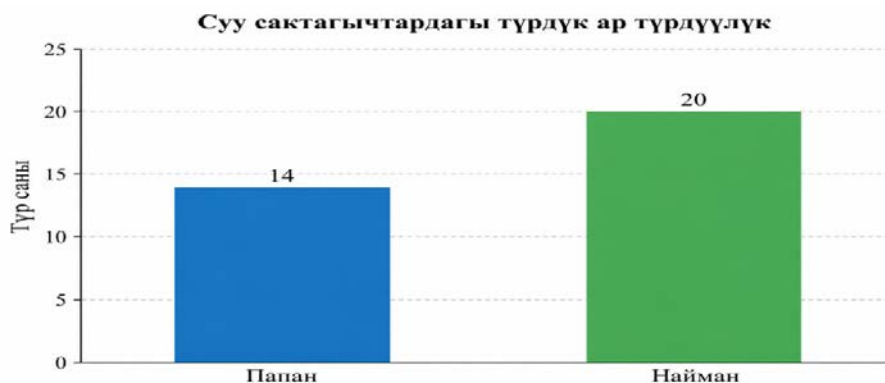
Сүрөт 3. Суу сактагычтардагы түрлөрдүн санынын салыштырмалуу көрсөткүчү

Фаунистикалык окшоштукта эки суу сактагыч үчүн орток болгон 8 ийкемдүү түр аныкталды. Алардын катарына төмөнкү түрлөр кирет: