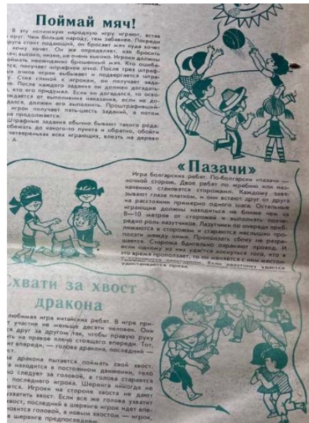
Рисунок 4. Зовет ребят на улицу веселая игра. Дружные ребята. №50. 21 июня 1986 г.

Эти материалы способствовали формированию сообществ, где дети могли общаться и обмениваться опытом, а также развивать свои навыки и способности через игры.