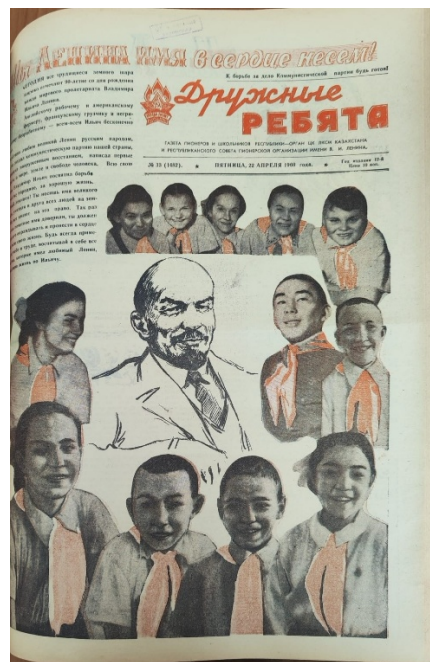
Рисунок 1. В.И. Ленин на страницах газеты «Дружные ребята» №13. 12 февраля и №33. 22 апреля 1960 г.

Содержание газеты было направлено на развитие способностей ребенка, расширение его кругозора и формирование характера. Благодаря такому разнообразному и интересному материалу, дети с удовольствием занимались чтением газет и получали знания и опыт. Публиковалась информация о различных кружках “занятия на любой вкус могут выбрать себе ребята в пришкольном лагере алматинской школы №58, здесь можно записаться на один из шести кружков, среди которых кружки кройки и шитья и танцевальный...” (рис.2, рис.3).