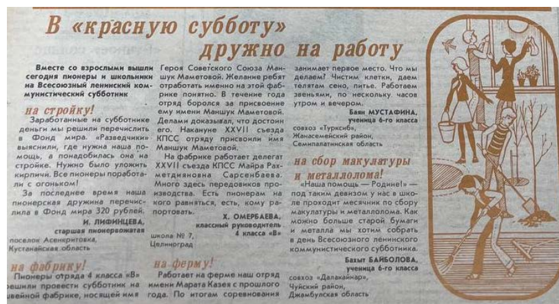
Рисунок 5. В «красную субботу» дружно за работу Дружные ребята. №32. 19 апреля 1986 г.

Иллюстрации носили воспитательную функцию, например, дети, которые объясняют друг другу, как правильно выполнять те или иные работы, отражая важность передачи знаний и опыта. Такие иллюстрации не только информировали о проведении субботников, но и формировали у детей ценности трудолюбия, коллективизма и ответственности за свой город и страну.