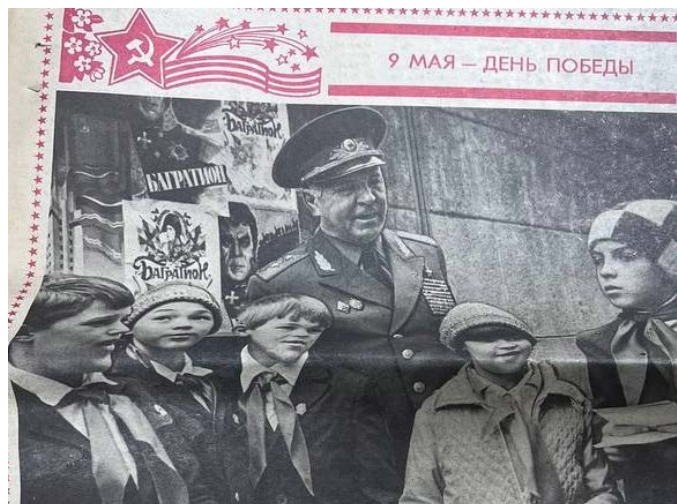
Рисунок 6. 9 мая - день Победы. Дружные ребята. №37. 7 мая. 1986 г.

Эти иллюстрации не только радовали глаз, но и воспитывали патриотизм, чувство гордости за свою страну и уважение к истории, передавая детям важные ценности.