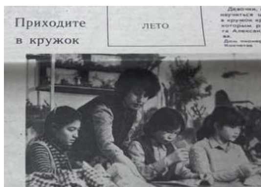
Рисунок 3. Приходите в кружок. Дружные ребята. №49. 18 июня. 1986 г.

Публиковалось множество материалов о играх, как традиционных, так и современных для того времени. Это были статьи, рассказы, инструкции, а также игры, которые могли быть как интеллектуальными, так и подвижными.