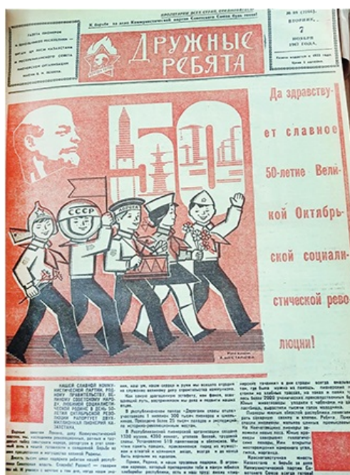
Рисунок 7. Юбилей октябрьской революции. Дружные ребята. №68. 7 ноября. 1967 г.

К юбилейным датам Советской власти газета инициировала патриотические темы. Так, к 50-летию октябрьской революции в 1967 году редакция газеты собрала и опубликовала материал о юных героях гражданской войны и планировала выпустить коллективный сборник «Этих дней не смолкнет слава», о чем сообщал редактор газеты А.Домбровский. (АП РК Ф.886. О.1. Д.2. Л.2.)