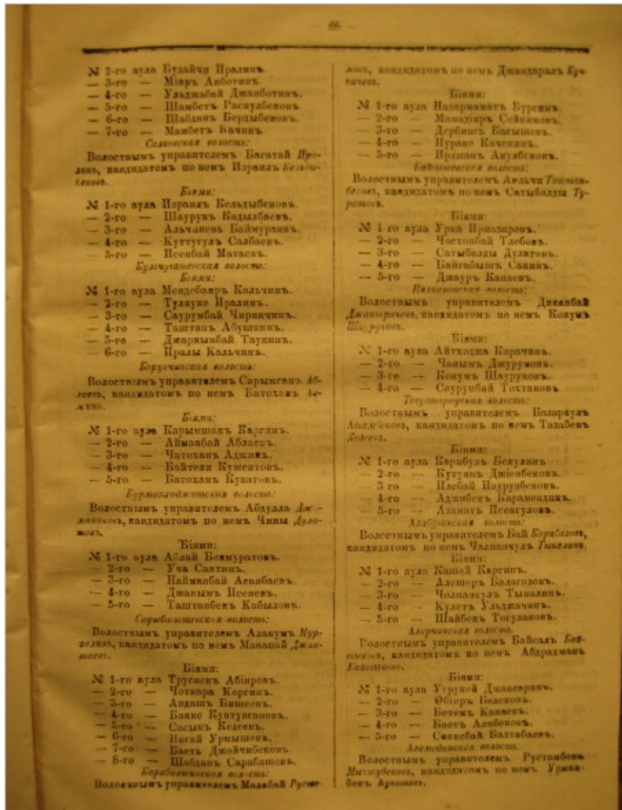
Сүрөт №1. «Публикации по Семиреченской области и Кульджинскому району» гезитинин 1874-жылдагы №18 санынын кыргыз болуштуктары жөнүндө жазылган бети.