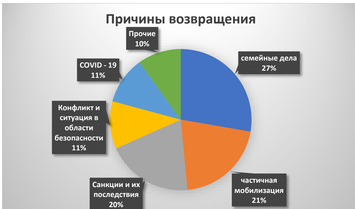
Рисунок 1. Причины возвращения трудовых мигрантов на родину

2022 год – год, когда Россия объявила о специальной военной операции (СВО). В этот период наблюдается резкий рост как эмигрантов, так и иммигрантов. Конфликт России с Украиной ухудшил положение трудовых мигрантов, отчасти из-за экономических санкций, введенных против России, которые коснулись в основном тех сфер деятельности, в которых мигранты заняты больше всего. Например, строительство, общественное питание, сфера доставки еды, а также сфера услуг и торговля.