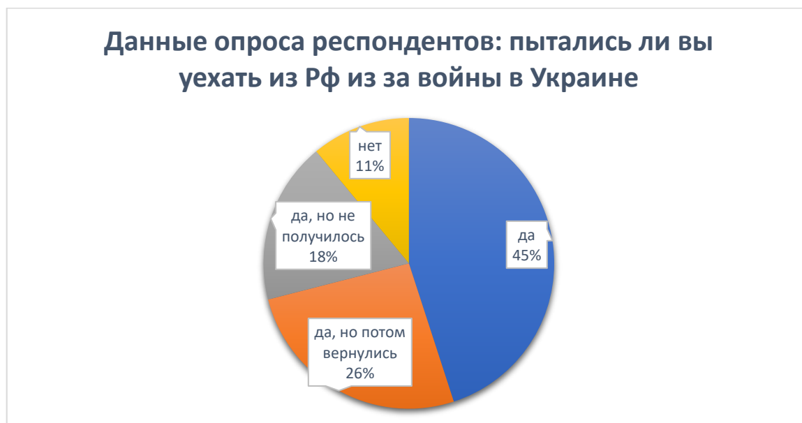
Рисунок 2. Влияние СВО на планы трудовых мигрантов в РФ.

2022 год – год, когда Россия объявила о специальной военной операции (СВО). В этот период наблюдается резкий рост как эмигрантов, так и иммигрантов. Конфликт России с Украиной ухудшил положение трудовых мигрантов, отчасти из-за экономических санкций, введенных против России, которые коснулись в основном тех сфер деятельности, в которых мигранты заняты больше всего. Например, строительство, общественное питание, сфера доставки еды, а также сфера услуг и торговля.