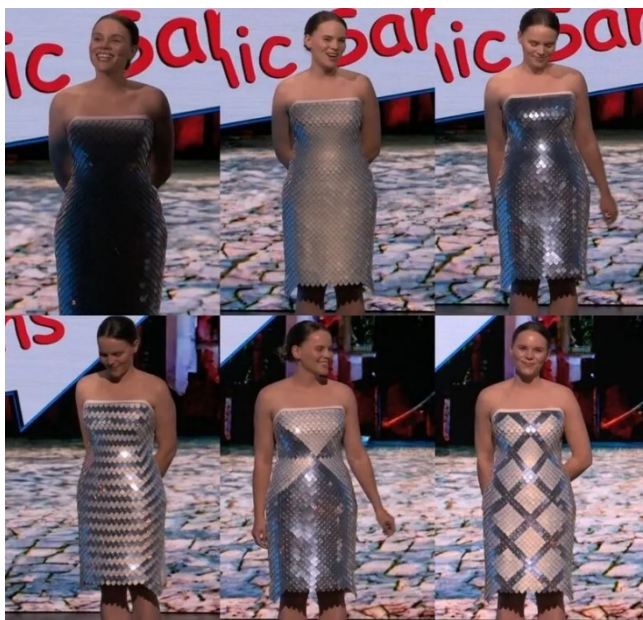
Рисунок 2. Футуристическое платье-трансформер.

Умные материалы представляют собой еще одну инновационную технологию, которая широко применяется в дизайне трансформируемой одежды. Эти материалы обладают свойствами изменяемой жесткости, эластичности или цвета, что позволяет создавать модели с изменяемой формой или внешним видом. Умные материалы могут использоваться как самостоятельные компоненты одежды, так и в сочетании с другими технологиями, такими как 3D-печать или сенсорные технологии, для создания уникальных и инновационных моделей [3].