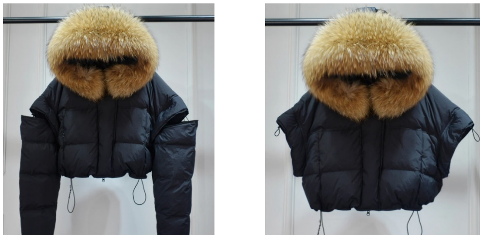
Рисунок 4. Женская куртка со съемным воротником и рукавами.

Многофункциональная женская куртка бренда «lagabogu» производства Китай, рукава и воротник съемные (рис.4).