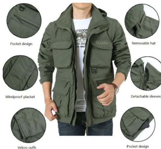
Рисунок 3. Мужская куртка со съемными рукавами

Ниже приведены примеры использования модульных компонентов для создания универсальных и гибких моделей одежды. На рисунке 3 представлена многофункциональная уличная повседневная мужская куртка со съемными рукавами бренда TiLeewon (Китай).