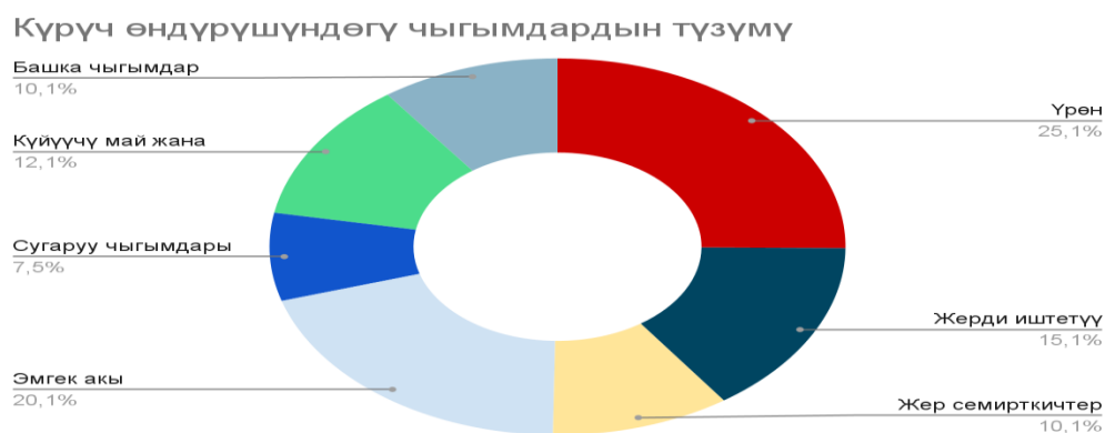
2-сүрөт. Күрүч өндүрүшүндөгү чыгымдар

Күрүчтү өндүрүүдө, эсепке алуунун өзгөчөлүктөрү катары чыгымдардын сезондуулугу, түшүмдү эсепке алуу, түшүмдүүлүктү анализдөө, сорттук эсепке алуу, өндүрүштүк этаптар боюнча эсепке алуу (урук чыгымдары, себүү аянттары, сугаруу, жер семирткичтер, отоо чөптөр каршы каражаттарды алуу, түшүм жыйноо чыгымдары, күрүчтү бастырып, данды алуу процесси), түшүмдүн сапатын эсепке алуу (дандын узундугу, дандын бүтүндүгү, кайра иштетүү сапаты), сатуу каналдарын эсепке алуу (өндүрүүчүдөн керектөөчүгө чейинки жолду документтештирүү, накталай акча менен жүргүзүлгөн соодаларды эсепке алуу, коомдук тамактануу ишканаларында күрүчтүн сарпталышын аналитикалык эсепке алуу), чен-өлчөө бирдиктерин стандартизациялоо. Күрүч өндүрүүдөгү эсепке алуу атайын ыкмаларды талап кылат. Алар: түшүмдүүлүктү так аныктоо, сорттук өзгөчөлүктөрдү чагылдыруу, өндүрүштүн бардык этаптарынын чыгымдарын өзүнчө эсептөө, ошондой эле бейрасмий сатуу каналдарында да продукциянын кыймылын көзөмөлдөө. Бейрасмий каналдарда продукциянын көлөмү эсепке алынбай же толук эмес көлөмдө катталат. Бул талаптардын аткарылышы күрүч чарбаларынын реалдуу рентабелдүүлүгүн аныктоого жана салыктык тобокелдиктерди азайтууга мүмкүндүк берет.