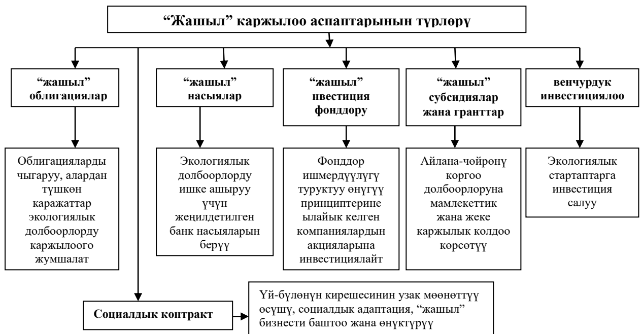
1-сүрөт. - “Жашыл” каржы аспаптарынын түрлөрү (авторлор тарабынан түзүлдү)

“Жашыл субсидиялар” түшүнүгү бизнестин экологиялык демилгелерин илгерилетүүгө багытталган салык чараларын билдирет. Бул чаралар ишканаларды жеңилдетилген жашыл насыялар менен камсыз кылуу жана жашыл облигацияларды чыгаруу формасын алат. Кыргызстанда жашыл субсидиялар кайра жаралуучу энергия боюнча долбоорлорду стимулдаштырууга, энергияны үнөмдөө жана айлана-чөйрөнү коргоого багытталган. Жашыл энергетика фонду каржылык колдоо көрсөтөт, ошондой эле Кыргыз Республикасынын Мамлекеттик өнүктүрүү банкы тарабынан/