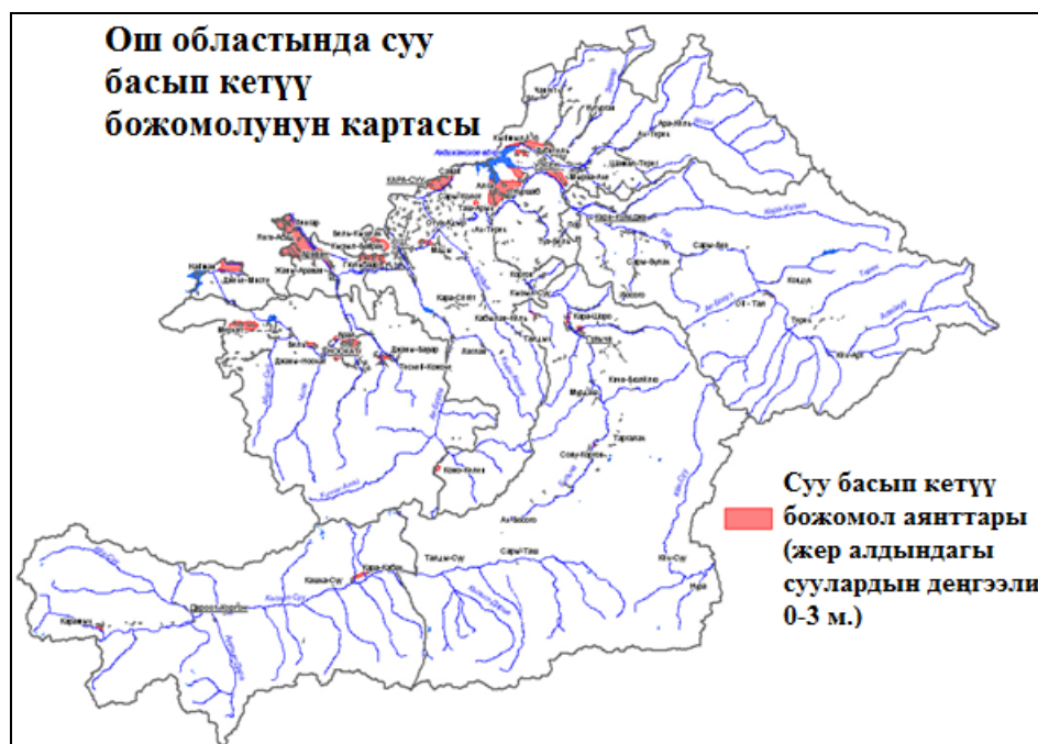
1-сүрөт. Суу коркунучунун картасынын мисалы [4].

«Табигый сууларды өзүн-өзү тазалоо» түшүнүгү бул маселе боюнча бир пикирге келмейинче, адабияттарда эки ача мааниде чечмеленет. Эң кеңири таралган идея суунун булганганга чейинки суу объектисине мүнөздүү болгон абалына суунун сапатын калыбына келтирүүгө алып келген физикалык, химиялык жана биологиялык процесстердин жыйындысы катары өзүн-өзү тазалоо жөндөмдүүлүгү жөнүндө.